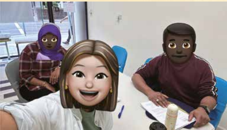
這是教會開放給我們使用作宣教學工的空間

我們與該教會合作至今僅九個月，已經有許多服侍非洲人的事工在這裡開展了。我們與穆民查經，舉辦非洲舞蹈小組和非洲婦女家長的團契，及輔導需要重置或將被遣返的非洲人等。