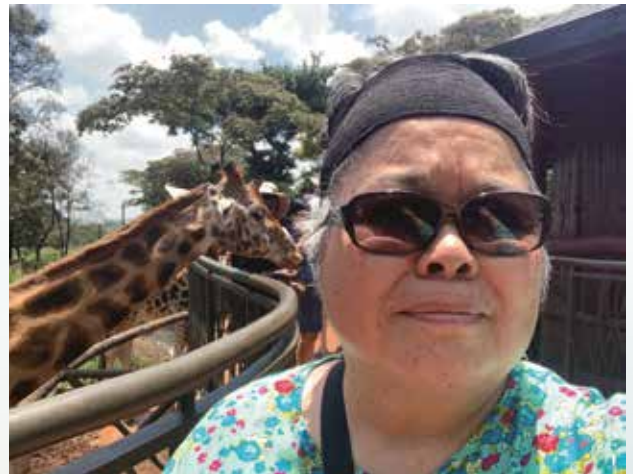
這是我第一次到長頸鹿的餵食中心